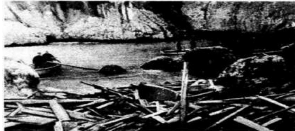
Il relitto del peschereccio genovese «L'Avante» naufragato sulla costa tirrenica della Sardegna

La sciagura di notte nel golfo di Grosi - Tre cadaveri galleggiavano sull'acqua - Il natante è affondato nella bata, a un centinaio di metri dalla riva - Vane le ricerche degli altri marittimi: il comandante è di Sampierdarena