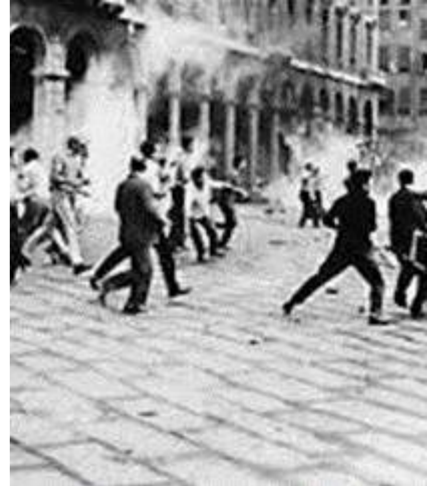
IL QUOTIDIANO DELL' ALLORA MSI