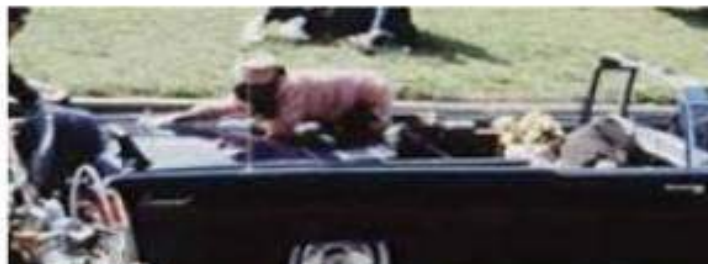
Il 22 novembre 1963 assassinio di Kennedy a Dallas, Texas